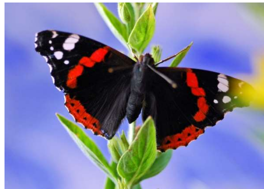
Admiral Vanessa atalanta