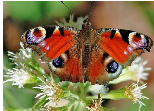
Tagpfauenauge Inachis io