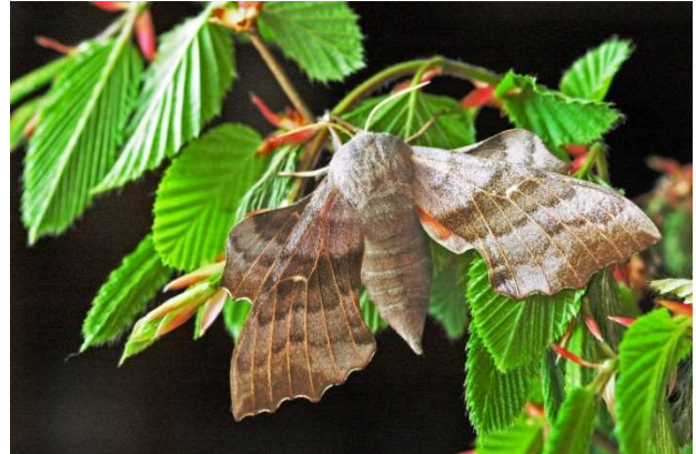
Pappelschwärmer Laothoe populi

Daheim angekommen, saß an meiner Gürteltasche ein