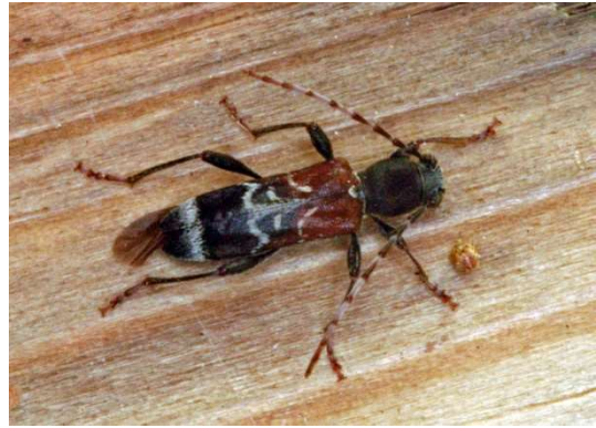
der Dunkle Zierbock Anaglyptus mysticus

Ich hoffe, ihr hattet einen schönen Tag Gerhard