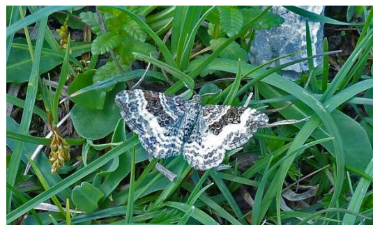
Graubinden-Labkrautspanner Epirrhoe alternata